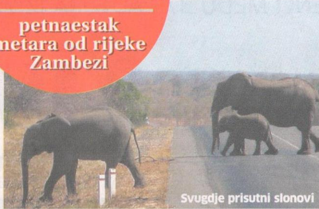
Svugdje prisutni slonovi